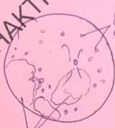
Multifocal Gr D RB