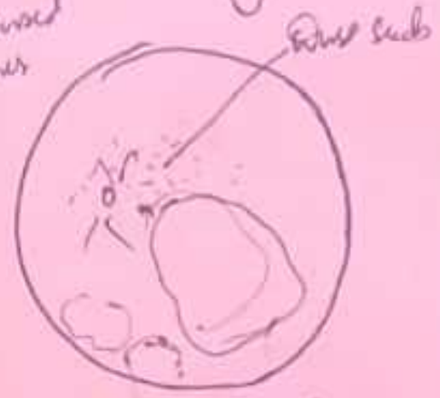
Multifocal Group D RB

कृपया इस कार्ड को सुरक्षित रखें तथा अस्पताल में दिखाने के समय हर वक़्त साथ लायें। Kindly keep this Card safely and bring it on your follow-up visits.